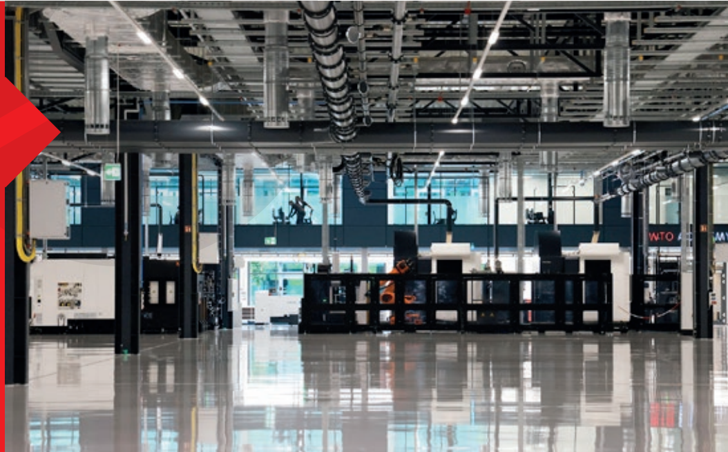
Blick in die Smart Factory von WTO.