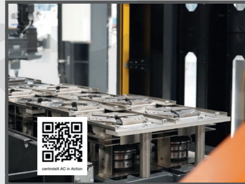
Für die Fertigung von unterschiedlichen Gehäusen stehen 18 Spann-Sets, bestehend aus Spannkopf mit Anschlag, zur Verfügung.