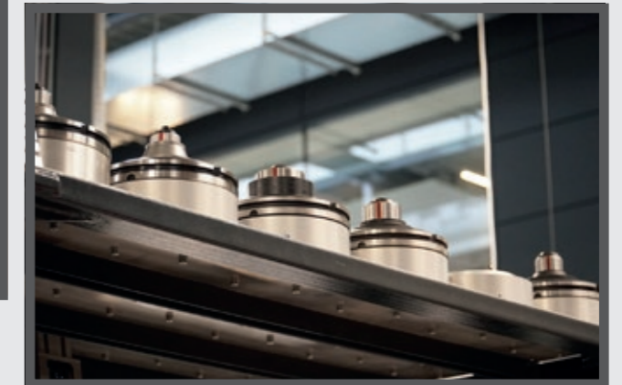
Die vorgerüsteten Spanndorne liegen für den automatisierten Spannmittelwechsel bereit.